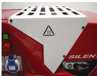
Berührungsschutz Auspuff optimale Abluft