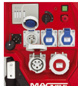
einfach und übersichtlich durch die optimale Anordnung aller Bedienelemente Isolationsüberwachung mit akustischer Warnung durch Hupe nach DIN 14685-1