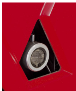
DIN Abgasstutzen mit Funkensieb für Ihre Sicherheit mit Aufnahme für Abgasschlauch